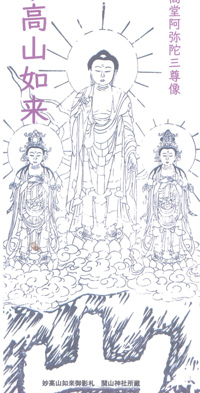
妙高山如来御影札 関山神社所蔵