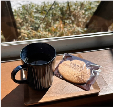
●ブレンド珈琲 ※妙高サブレ付き