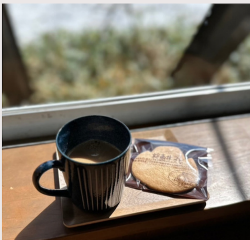
●チャイ ※妙高サブレ付き

疲れた身体にはチャイがおすすめです。チャイがもたらす効果は非常に多くむくみ解消・炎症の抑制・免疫力向上デトックス効果など数え切れません！また、寝る前の3～7時間前に飲むとリラックス効果もある為、良質な睡眠にも繋がります。